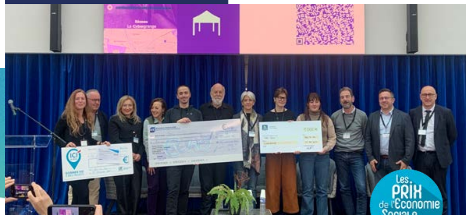
Remise des Prix ESS 2025 - Conférence Territoriale de l'ESS en Meuse le 25 novembre