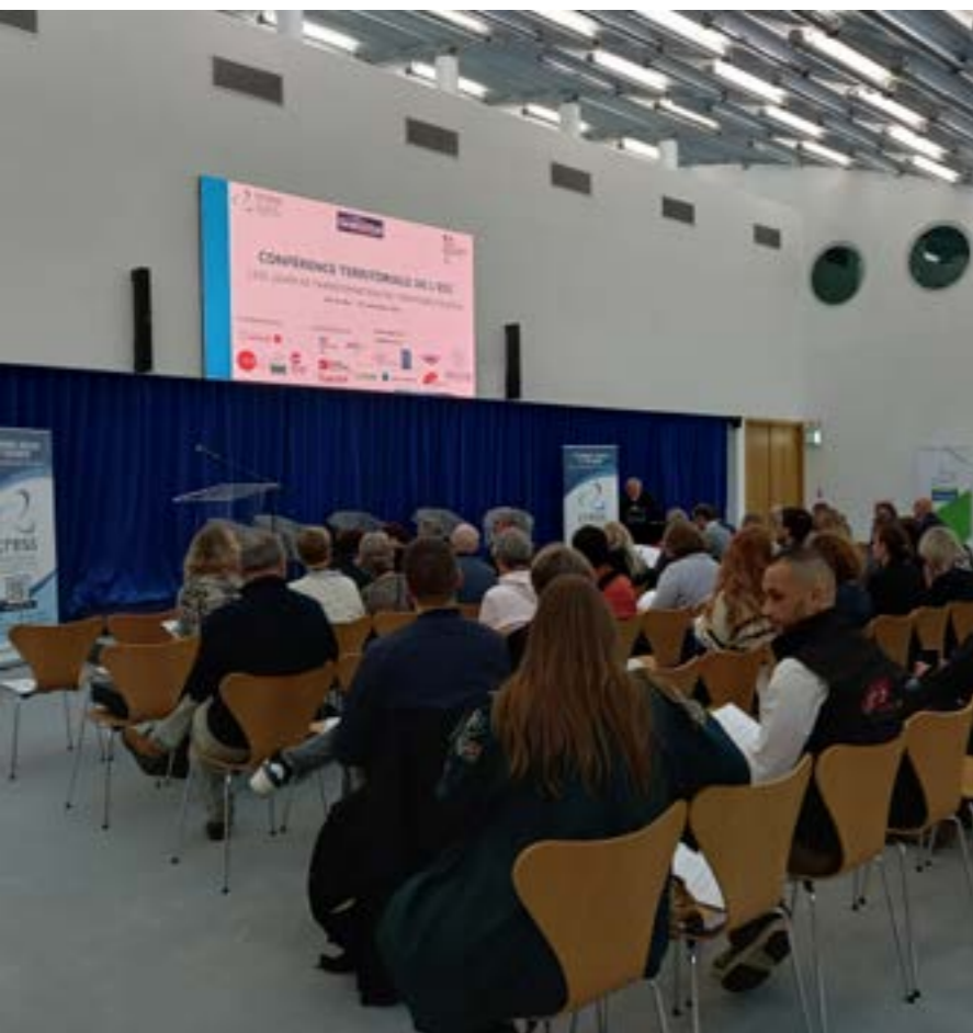
Conférence Territoriale de l'ESS en Meuse le 25 novembre

La CRESS Grand Est anime les Comités de pilotage et comités techniques de la Gouvernance Unie de l'ESS. Elle a coordonné les travaux partenariaux et assuré la mise en œuvre opérationnelle de la Conférence Territoriale de l'ESS en Meuse, organisée le 25 novembre 2025 à Bar-le-Duc.