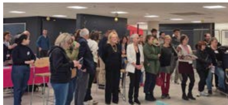
Forum des métiers et de l'entrepreneuriat porteurs de valeurs et de sens Reims - 16 décembre