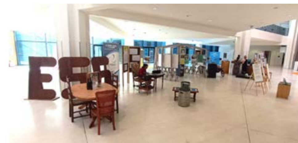
Assises Européennes de la transition énergétique à Strasbourg