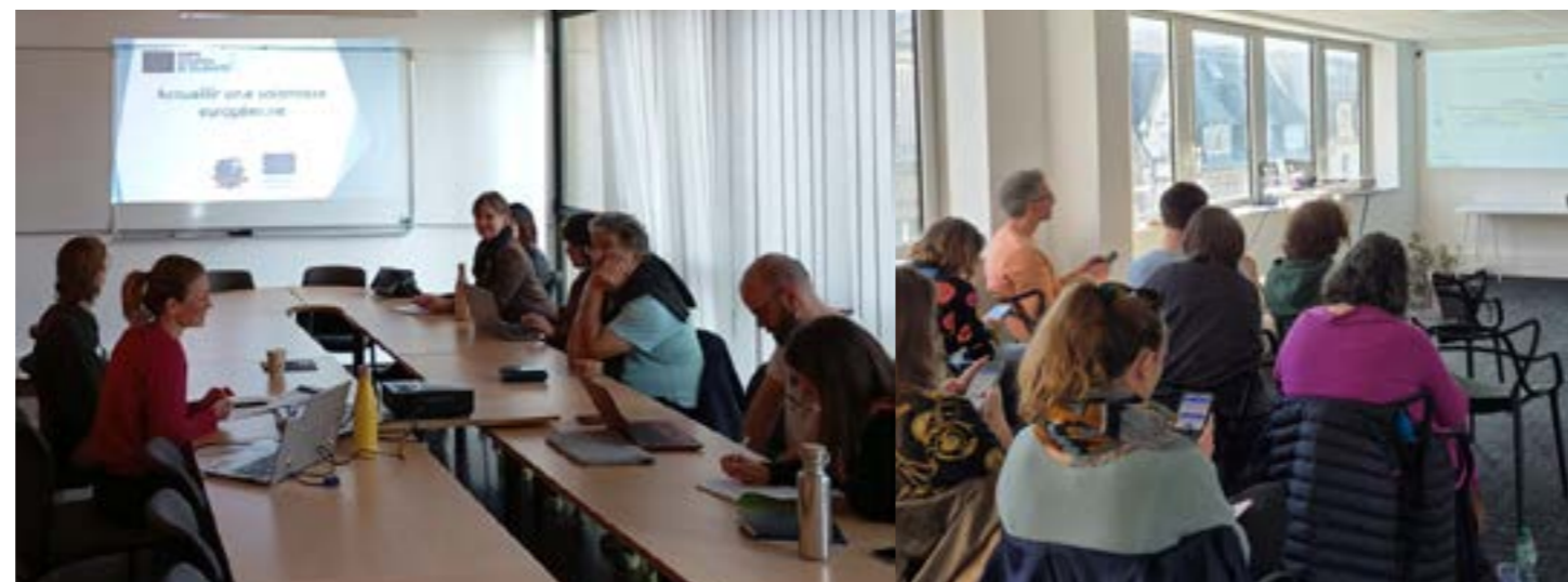
Club Europe Nancy - Meurthe-et-Moselle