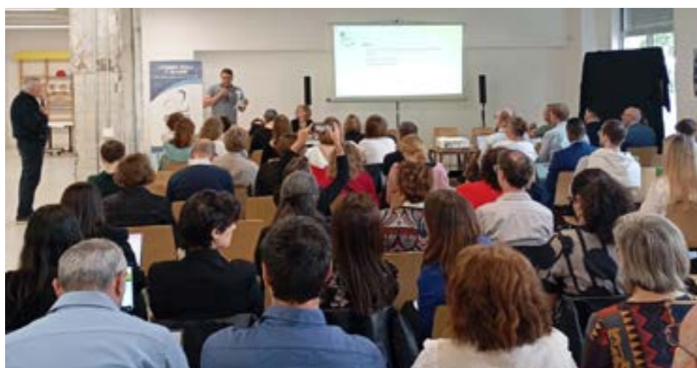
Rencontre du réseau REVES du 14 au 16 mai à Strasbourg

- les résidences locatives aidées senior et participatives : les Pot'âgés avec Habitat de l'III & Eco quartier Strasbourg, - la villa Génération avec Néolia et Familles solidaires Mulhouse, - l'art et le lien social en renouvellement urbain avec CDC Habitat Social et Lu2.