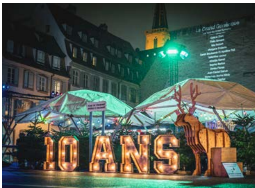
Marché OFF

Au-delà de l'accompagnement des acheteurs publics dans la mise en œuvre de leurs stratégies d'achats responsables, le Guichet Unique a engagé plusieurs chantiers structurants : > la diversification des segments d'achats intégrant des clauses sociales, afin d'élargir le champ des marchés mobilisables ; > le lancement d'un processus unifié, offrant aux partenaires un point de contact unique et contribuant à harmoniser les pratiques ; > le déploiement d'une nouvelle identité visuelle, traduisant un positionnement renforcé sur le territoire ; > la signature d'une convention expérimentale avec la Ville de Reims et la Communauté urbaine du Grand Reims, dans le cadre de leur SPASER (Schéma de Promotion des Achats Socialement et Ecologiquement Responsables).