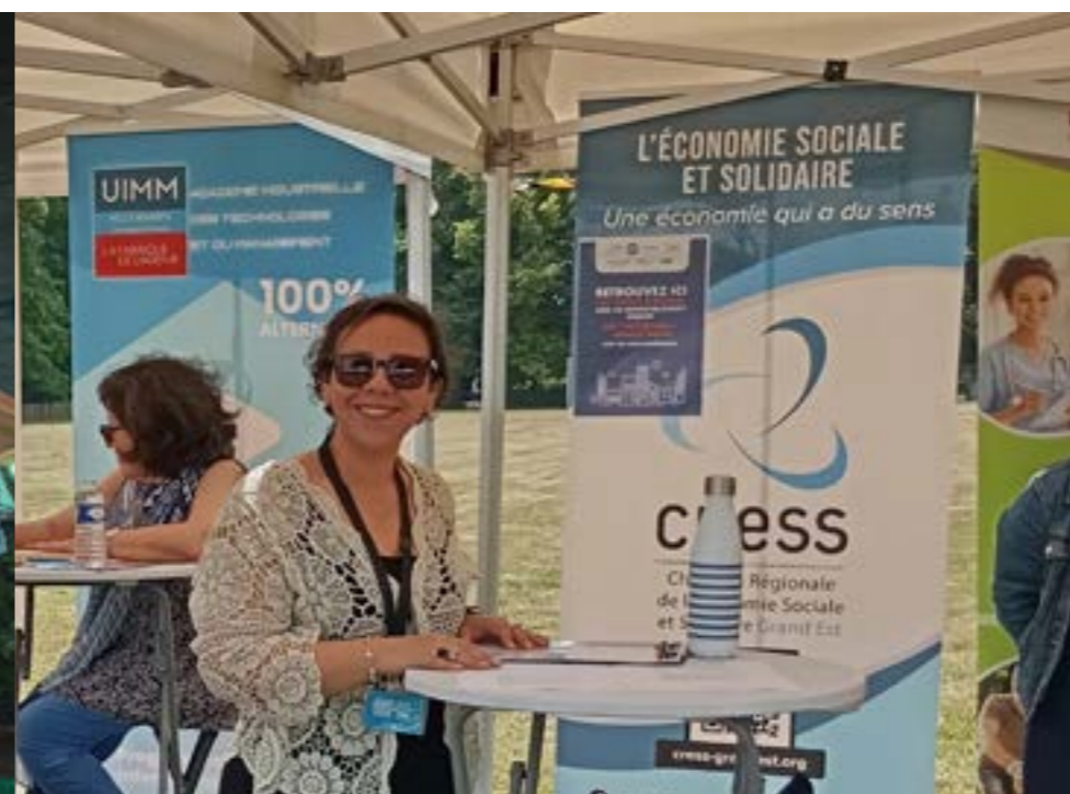
Caravane de l'emploi - Bétheny - Grand Reims