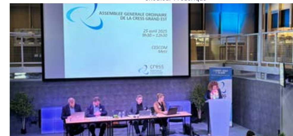
Assemblée Générale de la CRESS Grand Est