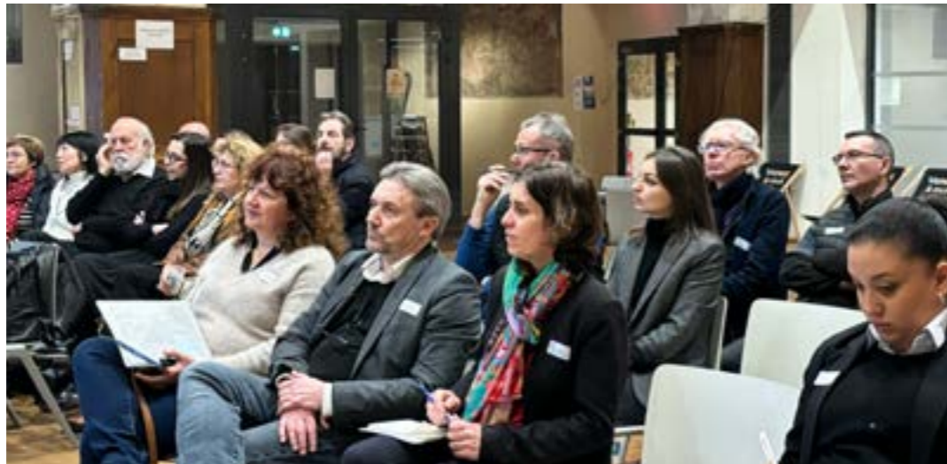
Rencontre administrateurs - salariés le 14 mars à Strasbourg

2025 a été marqué par le déménagement de l'antenne de Reims qui s'est installée en centre ville au 39 rue Hincmar.