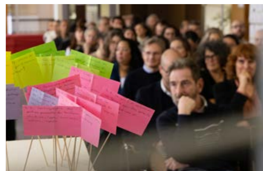
Conseil de l'ESS

La journée a rassemblé 85 participants sur les ateliers de la matinée. Les échanges se sont poursuivis au Centre international de Séjour et au Centre Saint-Ex, Culture Numérique. La SCIC L'Extra, la SCOP Jazz Us et l'association "des Idées plein la Terre" ont présenté leur modèle économique et les perspectives de développement.